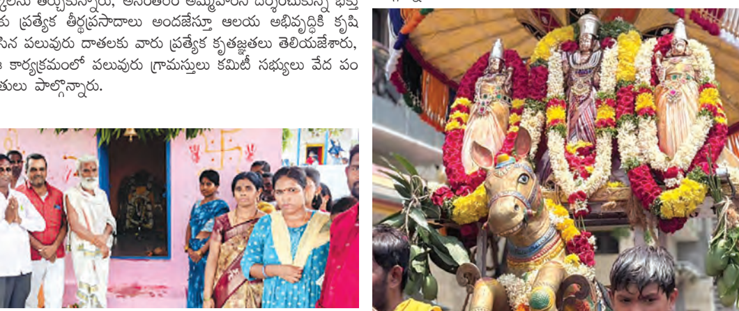
ప్రతిష్ఠా కార్యక్రమంలో పాల్గొన్నవారు

ప్రాంధులూరు ఆర్ట్స్, ఏప్రిల్ 10, ప్రభాతవార్త : పట్టణంలోని పెన్నా నది తీరాన, సాక్షాత్తు శ్రీరామచంద్రునివే ప్రతిష్ఠి తమైన శ్రీ రాజరాజేశ్వరి దేవి సమేత శ్రీ ముక్తి రామలింగేశ్వర స్వామి దేవస్థానంలో వార్షిక బ్రహ్మోత్సవాలలో భాగంగా శుభవారం అశ్వవాహనం నిర్వహించారు. ముందుగా ఉదయం ఆలయ మూలవిరాట్లలకు అభిషేకాలు, హోమం, కలశ పూజ జరిగాయి. ఆనంతరం అశ్వవాహనం, వసంతోత్సవం, బండ లాగుడు పోటీలు నిర్వహించారు. ఈ పోటీలలో పలు జతల ఎద్దుల ఉత్సాహంగా పాల్గొన్నారు. ప్రజలు పెద్ద ఎత్తున పాల్గొన్నారు.