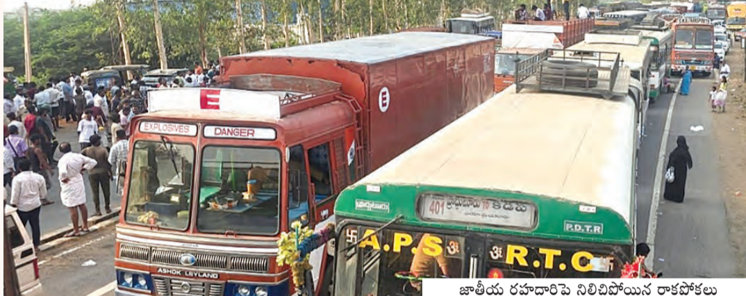
జాతీయ రహదారిపై నిలిచిపోయిన రాకపోకలు